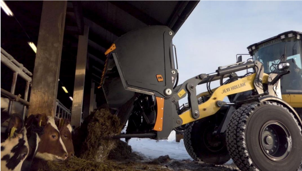
Abschieber in Aktion an einer Silocut L+-Zinkenversion.