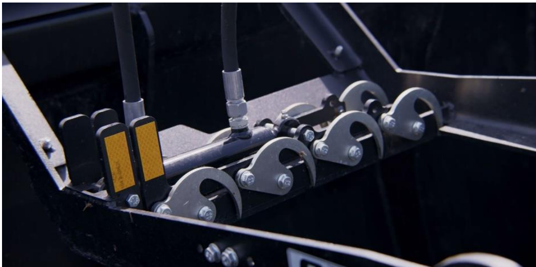
Folien-/Netzklammer, erhältliches Zubehör für Silocut L+ und XL+

Mehr über Ålö finden Sie auf www.alo.se und über unsere Produkte auf www.quicke.nu