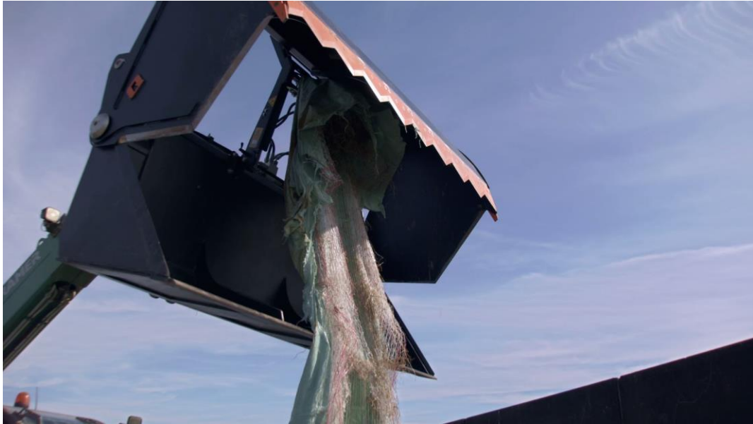
Folien-/Netzklammer an einer Silocut-Schaufelversion