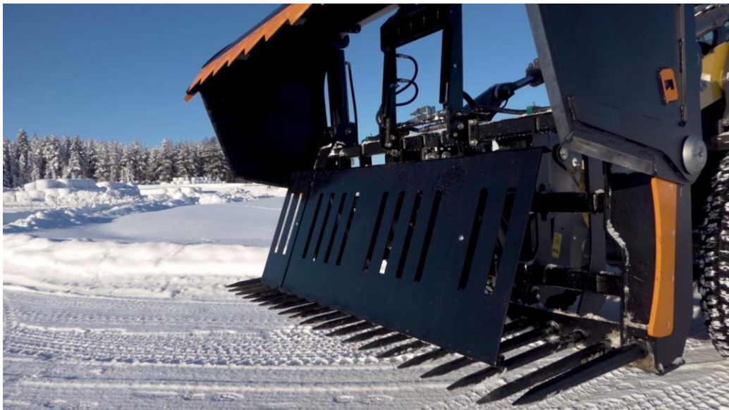
Abschieber an einer Silocut L+-Zinkenversion