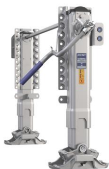
Sollevatore elettrico Modul E-Drive: