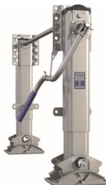
Il sollevatore dal peso ottimizzato OPTIMA: